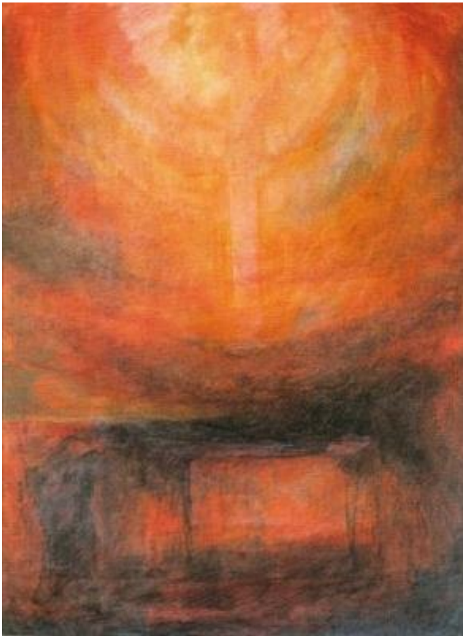
Osternacht - Ninetta Sombart