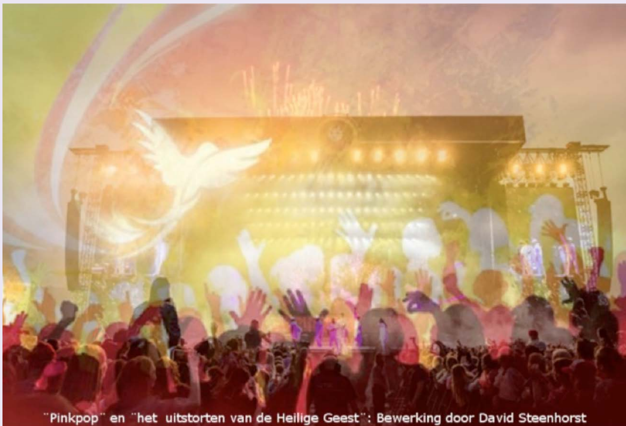
“Pinkpop” en “het uitstorten van de Heilige Geest”: Bewerking door David Steenhorst

Wind: Opvallend is dat het Bijbelse woord voor ‘wind’ ook ‘geest’ betekent. De Joden schreven visioenen, plannen en gedachten toe aan de kant van god die zij in het oude testament al ‘Heilige Geest’ noemde. Wind en geest zijn beide onzichtbaar en ongrijpbaar en zetten zo