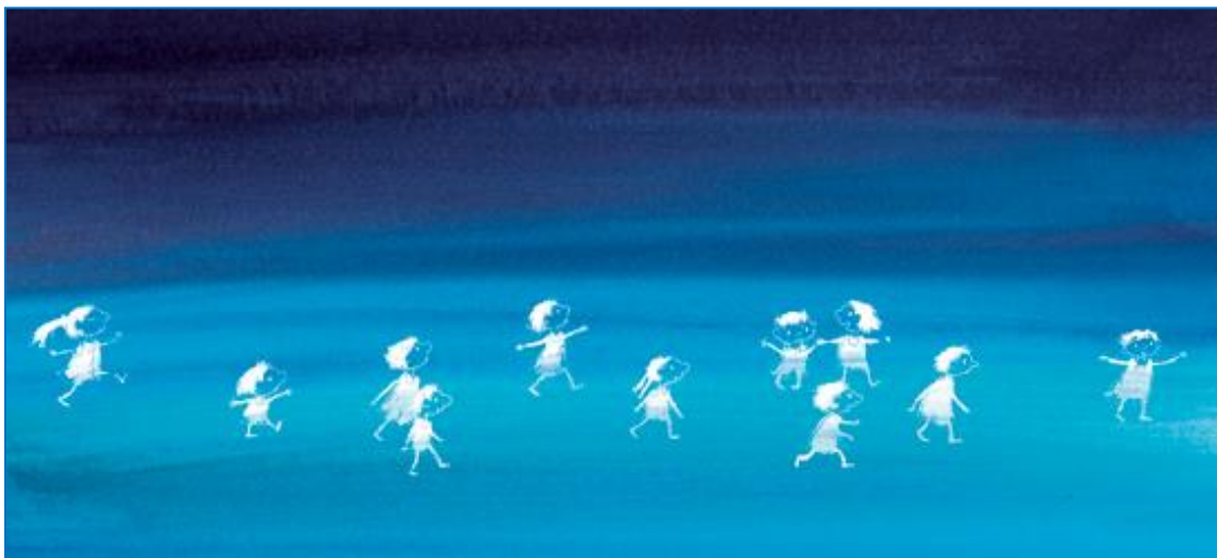
Illustratie door Mies van Hout